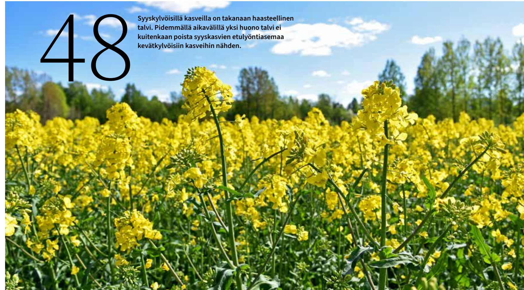
Syyskylvöisillä kasveilla on takanaan haasteellinen talvi. Pidemmällä aikavälillä yksi huono talvi ei kuitenkaan poista syyskasvien etulyöntiasemaa kevätkylvöisiin kasveihin nähden.