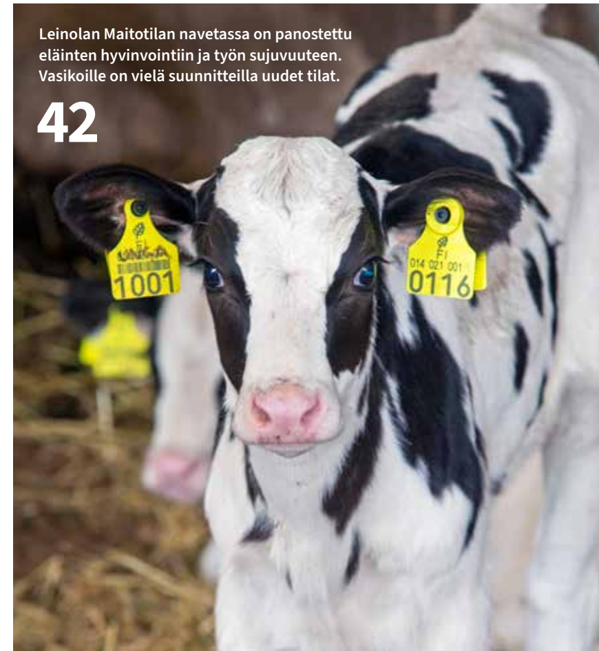
Leinolan Maitotilan navetassa on panostettu eläinten hyvinvointiin ja työn sujuvuuteen. Vasikoille on vielä suunnitteilla uudet tilat.